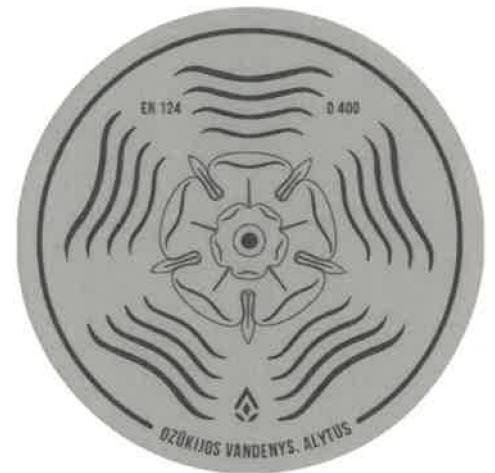
1 pav. Dangčio maketas

15.8. ant dangčio turi būti užrašas DZŪKIJOS VANDENYS, ALYTUS ir logotipas, dangčio maketas turi būti analogiškas 1 pav.;